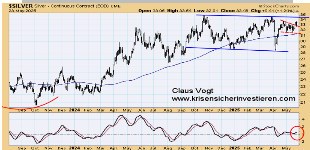
SILBERPREIS IN $ PRO UNZE, PREIS-MOMENTUM-OSZILLATOR, 2023 BIS 24. MAI 2025

Basierend auf dem Anstieg über die Obergrenze der rotgestrichelt eingezeichneten Flaggenformation und den gleichzeitig gegebenen Kaufsignalen des Preis-Momentum-Oszillators (unten im Chart) sowie des hier nicht gezeigten MSA-Momentum-Indikators haben wir den Wiedereinstieg bei Silber empfohlen.