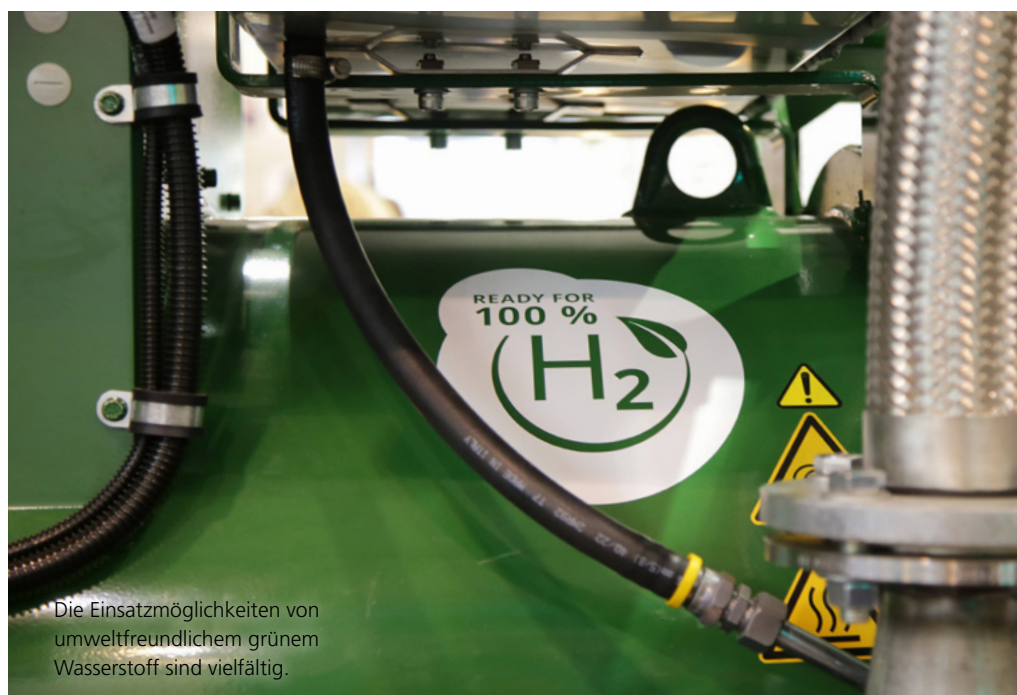
Die Einsatzmöglichkeiten von umweltfreundlichem grünem Wasserstoff sind vielfältig.

Für Anleger ist das Investment in umweltfreundliche Technologien wie die ACA-Technologie gleich aus mehreren Gründen interessant. Zum einen unterstützen die Anleger durch ihr Investment die Lösungsfindung für verschiedene Umweltprobleme, zum anderen können die Anleger von einem starken Wachstum dieses Wirtschaftszweiges ausgehen und somit auf eine enorme Wertsteigerung ihres Investments hoffen. Die Investoren sind also ein Teil des treibenden Motors für die Förderung innovativer Umweltlösungen und ungewöhnlicher Forschungsprojekte, sie leisten also einen entscheidenden positiven gesellschaftlichen Beitrag. ♦ MK