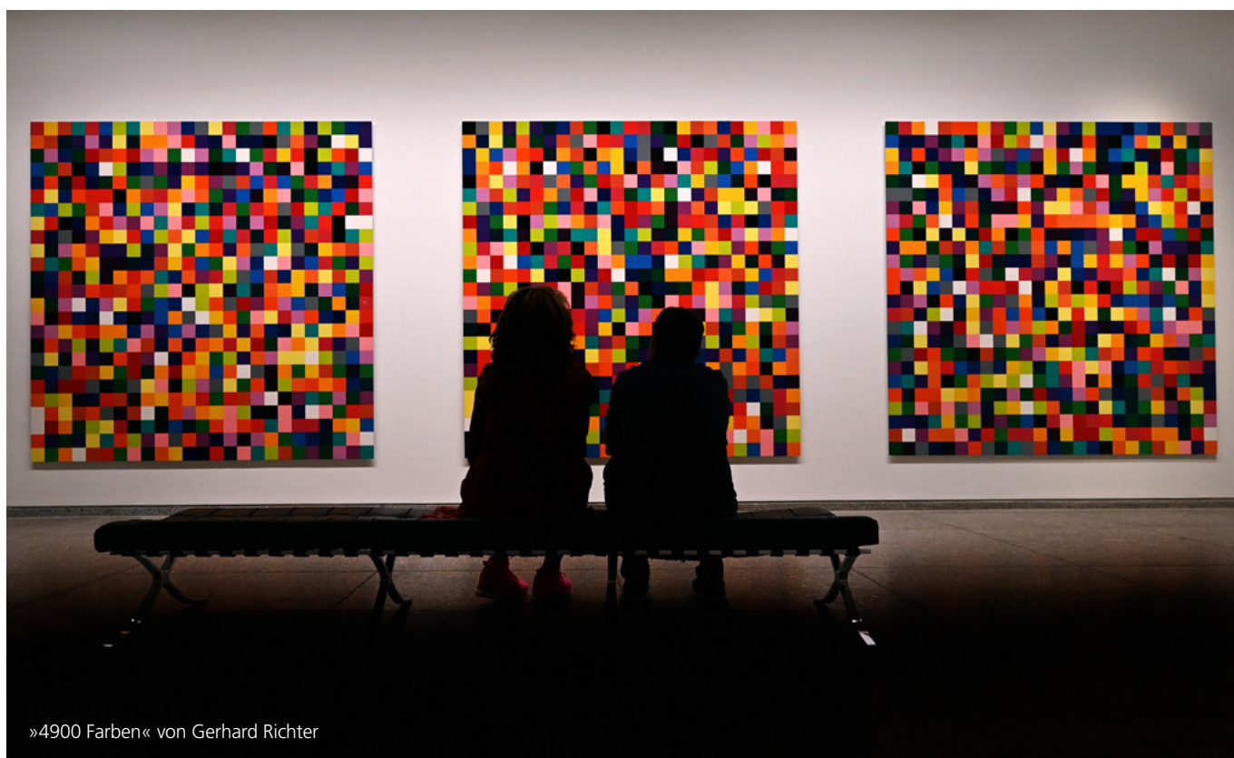
»4900 Farben« von Gerhard Richter