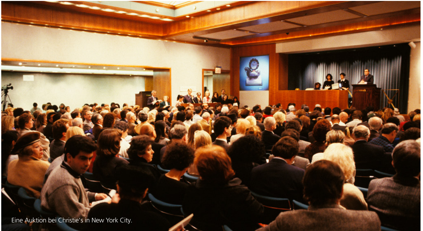
Eine Auktion bei Christie's in New York City.

Geschmack zu entwickeln. Auch Kunstblogs helfen, den Markt besser einschätzen zu können. Denn irgendwann gelangt man an den Punkt, das erste Kunstwerk zu kaufen. Und da ist die Hemmschwelle angesichts des Risikos auf den falschen Künstler zu setzen, relativ hoch. Manche investieren niedrige vierstellige Beträge in unbekannte Künstler und hoffen auf eine Wertsteigerung, andere nehmen gleich viel Geld in die Hand und kaufen ein Bild von beispielsweise Gerhard Richter, für dessen Werke Millionen gezahlt werden. Zu den »Blue Chips« des Kunstmarktes zählen zum Beispiel auch Pablo Picasso, Alexej Jawlensky, Jeff Koons, Joan Mitchell, Willem de Kooning oder Lucio Fontana, für deren Werke viel Geld übrig sein sollte. Wie es kommen wird, kann keiner sagen. Galeristin Dominique Lévy rät, »Eier in verschiedene Körbe zu legen«. Ihrer Erfahrung nach kämen angesichts der unzähligen Teilmärkte auf drei Kunstwerke, deren Wert steige, zehn, bei denen sich der Erfolg nicht einstelle.