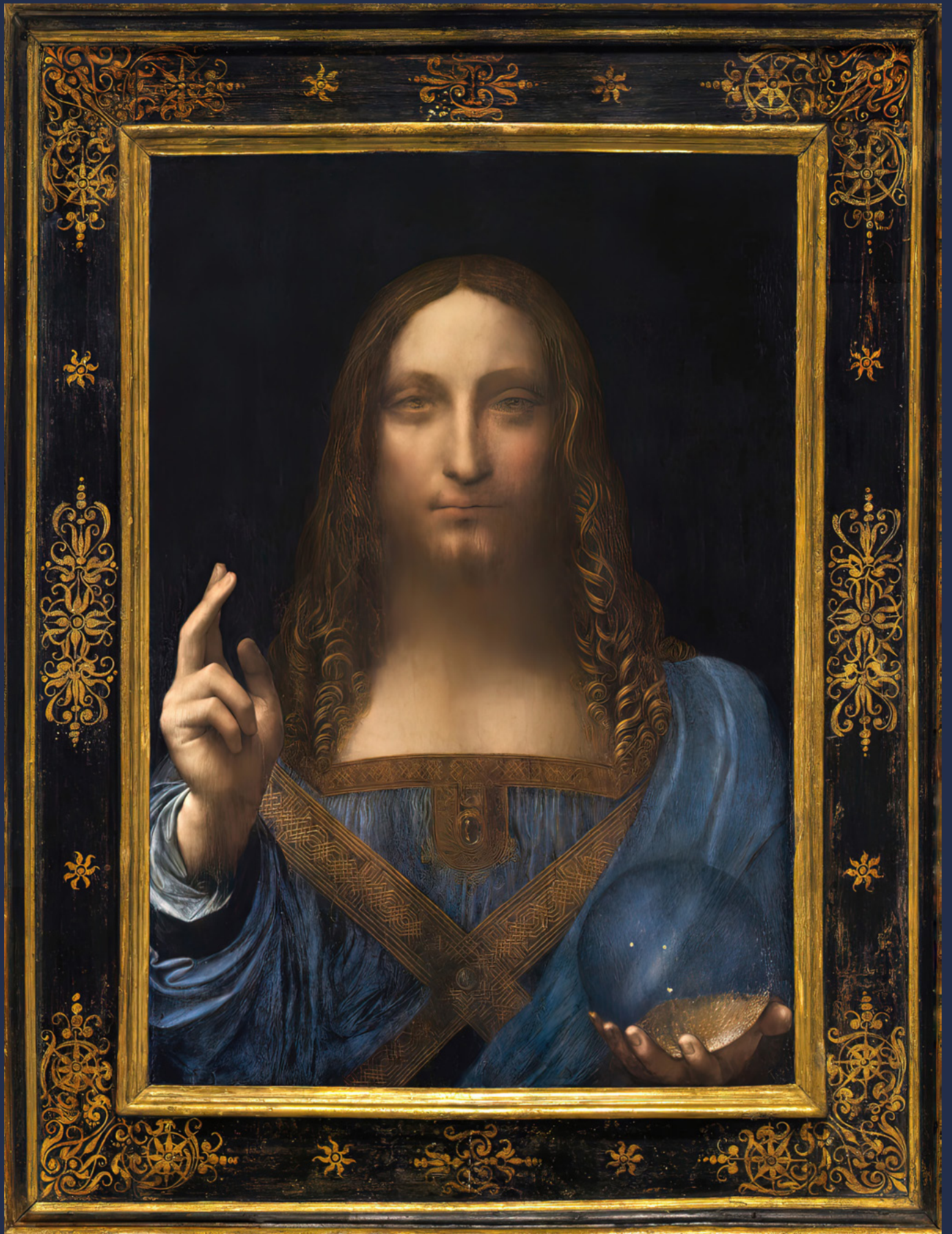
Das teuerste Ölgemälde der Welt: »Salvator Mundi« wird Leonardo da Vinci zugeschrieben und auf die Zeit um 1500 datiert.