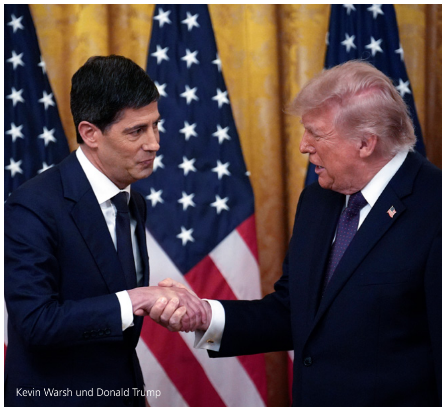
Kevin Warsh und Donald Trump