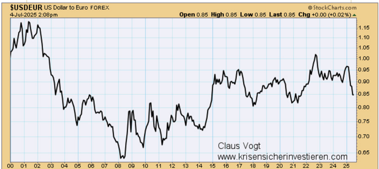
EURO / DOLLAR, MONATSCHART, 2000 BIS 2025

Der Dollar ist seit Anfang des Jahres zwar gefallen (und der Euro entsprechend gestiegen). Im etwas größeren Bild gesehen, handelt es sich dabei um eine unbedeutende Bewegung, schließlich befindet sich der Kurs immer noch in seiner Spanne der vergangenen 10 Jahre.