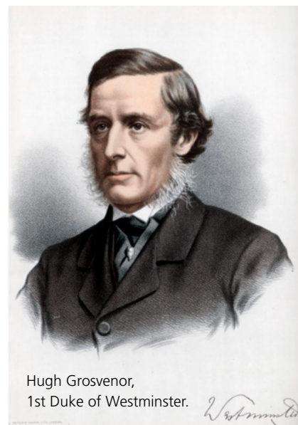
Hugh Grosvenor, 1st Duke of Westminster.