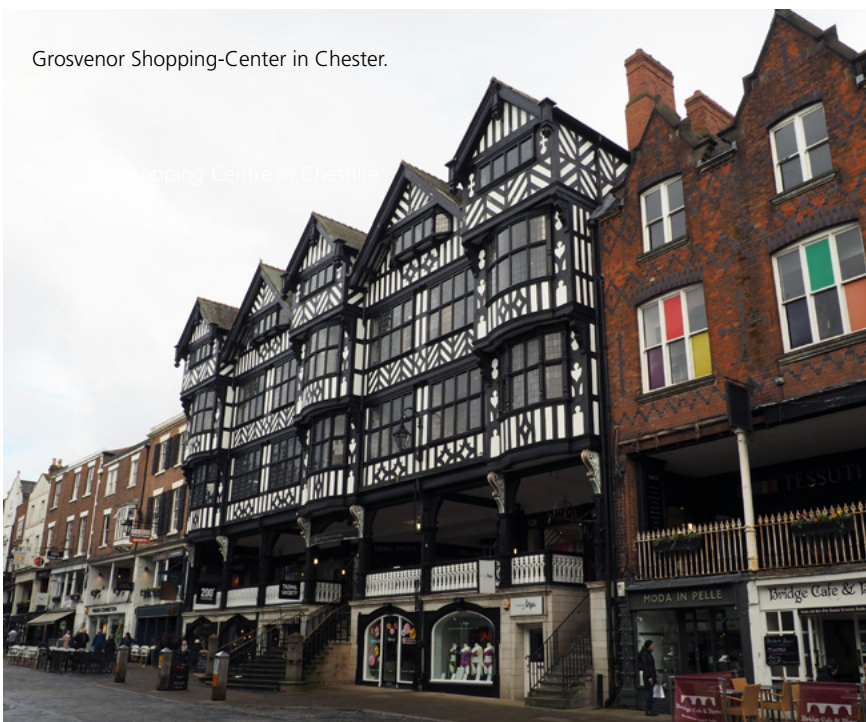
Grosvenor Shopping-Center in Chester.

Heute wird das Grosvenor-Imperium von Hugh Grosvenor geführt. Nachdem er nach dem Tod seines Vaters Gerald Grosvenor im Jahr 2016 das Erbe antrat, wurde er einer der jüngsten Milliardäre der Welt. Unter seiner Leitung hat die Grosvenor Group ihre globale Reichweite weiter ausgebaut. Das Unternehmen investiert laut eigener Angaben heute in nachhaltige und innovative Immobilienprojekte.