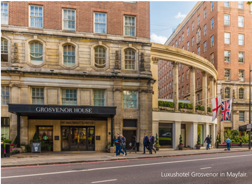
Luxushotel Grosvenor in Mayfair.