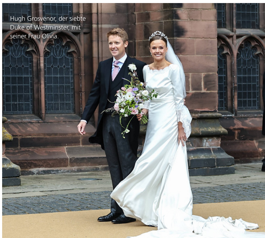
Hugh Grosvenor, der siebte Duke of Westminster, mit seiner Frau Olivia.

Doch Geld allein sichert den Wohlstand nicht. Im 20. Jahrhundert erkannte die Familie, dass es notwendig war, ihr Vermögen zu diversifizieren und auf zeitgemäße Strategien zu entwickeln. Daher gründete sie die Grosvenor Group, eine heute bedeutende internationale Immobiliengesellschaft, die sich auf Investitionen und Entwicklungsprojekte in Großbritannien, Europa, USA und Asien spezialisiert. Die Familie erschloss fortan neue Märkte und vermehrte ihr Vermögen weiter. Zur Grosvenor Group ▶