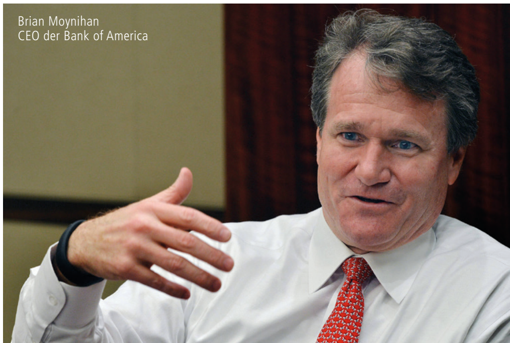
Brian Moynihan CEO der Bank of America

Andererseits haben Banken einen Anreiz, digitale Zahlungen zu fördern. Zwei Haupteinnahmequellen von Großbanken sind Zinsen und Gebühren. Kreditkarten verschaffen ihnen beides, und Debitkarten verschaffen ihnen Gebühreneinnahmen. Ihre Abteilungen für digitalen Zahlungsverkehr sind Profitcenter, die einen positiven Ertrag generieren. Ihre Geschäftsberichte bestätigen diese Einschätzung; sie rühmen sich ihrer Erfolge beim Ausbau ihrer Abteilungen für digitale Zahlungsabwicklung, während sie ihre lahmen oder kostspieligeren physischen Filial- und Geldautomatennetze