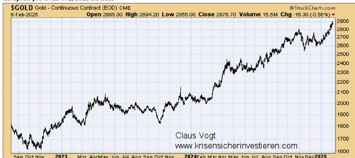
Goldpreis pro Unze in $, 2022 bis 2025

Unbeachtet von der Mehrheit der Anleger nimmt die Goldhausse ihren Lauf.